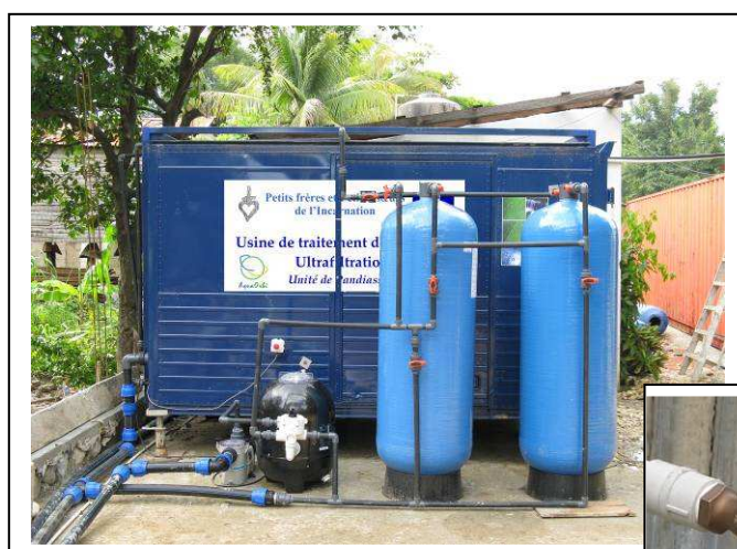
L'usine est mise en eau