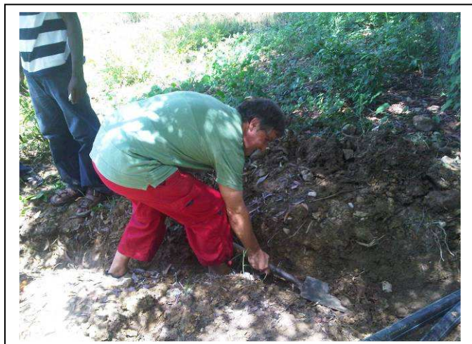
Pose des derniers tronçons de canalisation. Tout le monde s'y met ...