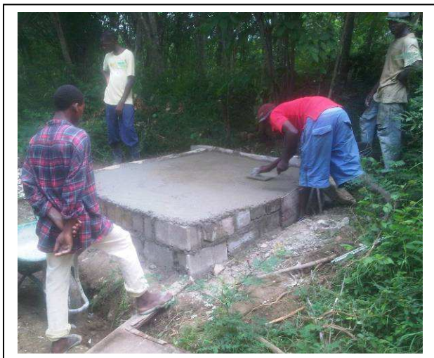
Travaux de maçonnerie