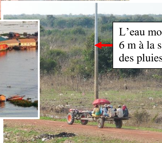
L'eau monte de 6 m à la saison des pluies