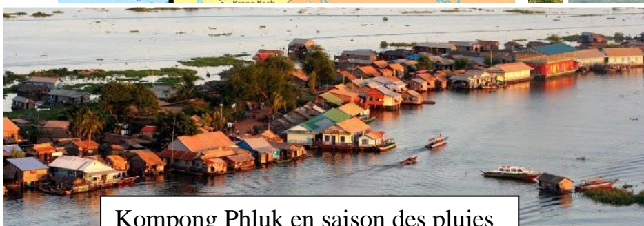
Kompong Phluk en saison des pluies